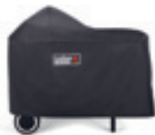
Custodia deluxe Rif. 7455