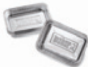
Vaschette in alluminio Rif. 6416